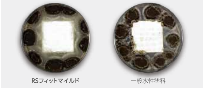
RSフィットマイルド